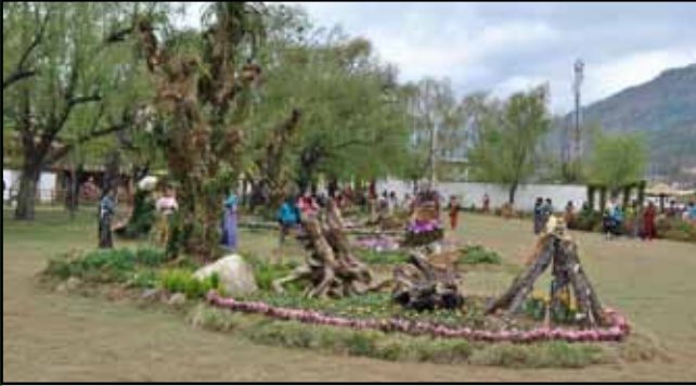
འབྲེམ་སྟོན་དང་ཚོང་འབྲེལ་གྱི་ལུ་བཀྲམ་བཞག་ཡོད་པའི་མི་རྟོག་མ་འདྲ་བའི་རིགས་ཚུ།

གནང་ཡོད་པ་ཨིན།” འབྲེམ་སྟོན་འདི་ནང་ ལྷུ་མ་ར་བཟོ་མི་བརྒྱུད་ཀྱིས་བཅའ་མར་ གཏོགས་ཐོག་ལས་ ལྷུ་མ་ར་དག་ཤོས་ཀྱི་དོན་ལུ་ འབྲེམ་བསྐྱེད་ འབད་དེ་ཡོད་པ་ཨིན། འབྲེམ་བསྐྱེད་ནང་བཅའ་མར་གཏོགས་མི་ཚུ་ གིས་ ལས་རིམ་དེ་གྲུབ་འབྲས་ཅན་ཅིག་སྟེ་འགྲོ་མི་ལུ་ བསམ་པ་ རྫོགས་ཡོད་པའི་བསམ་འཆར་ཚུ་བཞག་དེ་ཡོད་པའི་ཁར་ འབྲུག་མི་ ཚུ་ཡང་ མི་རྟོག་ལུ་སྟོབ་སྟོམ་ཡོད་པའི་ ཤེས་རྟོགས་བྱུང་ཡི་ཟེར་ ཨིན་མས། འབྲེམ་སྟོན་ནང་ལུ་འོང་མི་ལེ་ཤ་ཅིག་གིས་ སྟོ་ཤིང་མེ་ རྟོག་གི་ཅངས་ཚུ་ ཉེ་སྟེ་ཡོད་པ་ལས་ མི་རྟོག་ཁར་མཛུས་རྟོག་རྟོ་སྟེ་