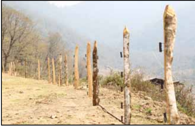
སྤྱི་ལོ་ ༢༠༡༥ ལྷོ་ལྷོ་ ༣ པའི་ཚེས་ ༢ པའི་ཚེས་ ༢ པ། ནང་ལུ་གཞི་བཙུགས་འབད་ཅུག

འགོ་རང་འབྲོངས་བཟོ་ནིའི་དམིགས་ཡུལ་སྐྱབ་ནིའི་དོན་ལུ་མི་ སེར་སོ་ནམ་པ་ཚུ་དང་ སོ་ནམ་དང་ནགས་ཚལ་ལྷན་ཁག་གཉིས་ མཉམ་ཟུབ་ཀྱི་ཐོག་ལས་ལཱ་འབད་དགོཔ་ཁག་ཚེ་ཟེར་གསུངས་ གནང་ཡི། དཔུང་སྤོན་པོ་གིས་ སྤྱི་ལོ་ ༢༠༡༥ ལྷོ་ལྷོ་ མཚམས་ཚུང་ཁག་ཚུ་ནང་ལུ་ མོ་བཏབ་འབད་དེ་ཡོད་པ་ལས་ ལྷུབ་ འབྲས་ཅན་ཅིག་སྤོན་ཡི་ཟེར་ཡང་གསུངས་གནང་ཡོད་པ་ཨིན། ཁོང་སོ་ནམ་པ་ཚུ་གིས་ གཞུགས་ཁ་ལུ་ ཞིང་ཚུ་དང་ལས་མི་མ་ཐོབ་ པའི་དཀའ་ངལ་ཚུ་འོ་སྤོར་ལས་ ལྷུབ་ལུ་བའི་སྐྱབས་ལུ་ སྤོན་ པོ་གིས་ ལྷན་ཁག་ཁ་ལྷུག་ལས་ དཀའ་ངལ་ཚུ་སེལ་ནིའི་ཐབས་ ལམ་གྱི་འོས་འབབ་ཚུ་ཡང་བལྟ་འོང་ཟེར་གསུངས་གནང་པའི་ཁར་ ཤ་མོ་འཇུགས་སྤྱོད་འབད་ནིའི་འོས་འབབ་དང་ རྒྱབ་སྐྱོར་ཚུ་ཡང་ ལྷན་ཁག་གི་ཁ་ལྷུག་ལས་གནང་འོང་ཟེར་གསུངས་གནང་ཡོད་པའི་ གནས་ཚུལ།